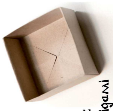
Masure en origami La masure était une petite boîte en bois servant à mesurer la quantité de riz.

Pliage de feuilles de papier carrées pour former sans collage et sans découpage des animaux, des fleurs, des objets.